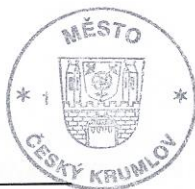
Mgr. Dalibor Carda starosta města Český Krumlov